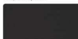
RR 32 (RAL 8019) темно-коричневый