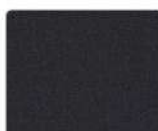
RAL 7024 мокрый асфальт