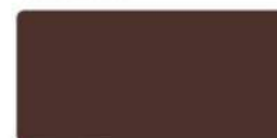
RAL 8017 шоколад