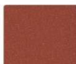
RAL 8004 терракота