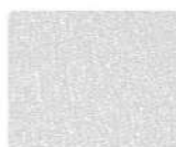
RAL 9003 белый