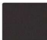
RR 32 (RAL 8019) темно-коричневый