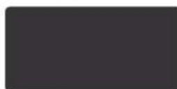
RAL 7024 мокрый асфальт