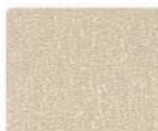
RAL 1015 светлая слоновая кость