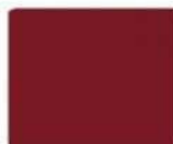
RAL 3005 красное вино